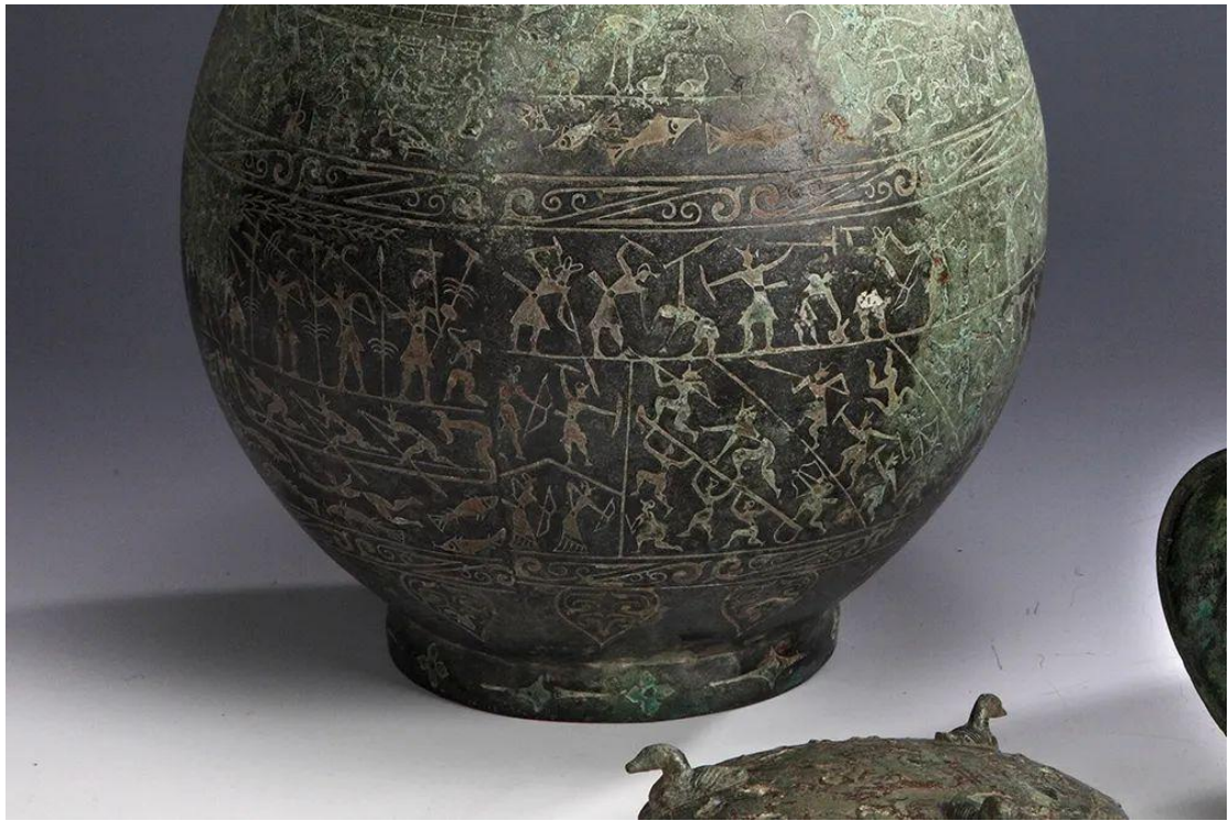
中国航海博物馆馆藏 水陆攻战船纹铜壶